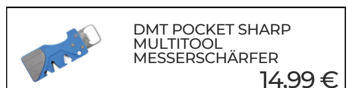
DMT POCKET SHARP MULTITOOL MESSERSCHÄRFER