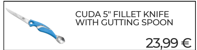
CUDA 5" FILLET KNIFE WITH GUTTING SPOON