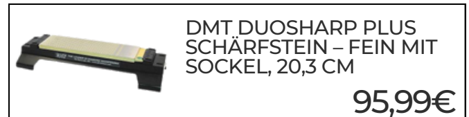
DMT DUOSHARP PLUS SCHÄRFSTEIN - FEIN MIT SOCKEL, 20,3 CM