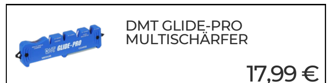
DMT GLIDE-PRO MULTISCHÄRFER