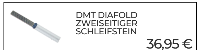
DMT DIAFOLD ZWEISEITIGER SCHLEIFSTEIN