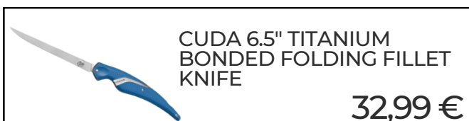
CUDA 6.5" TITANIUM BONDED FOLDING FILLET KNIFE