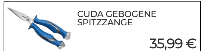
CUDA GEBOGENE SPITZZANGE