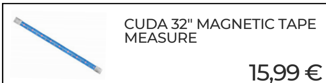
CUDA 32" MAGNETIC TAPE MEASURE