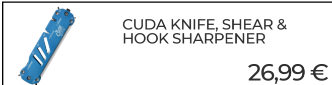
CUDA KNIFE, SHEAR & HOOK SHARPENER