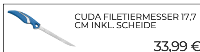
CUDA FILETIERMESSER 17,7 CM INKL. SCHEIDE