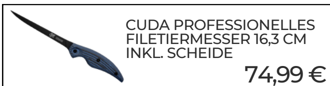
CUDA PROFESSIONELLES FILETIERMESSER 16,3 CM INKL. SCHEIDE