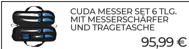
CUDA MESSER SET 6 TLG. MIT MESSERSCHÄRFER UND TRAGETASCHE