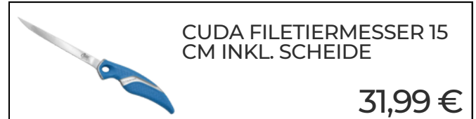
CUDA FILETIERMESSER 15 CM INKL. SCHEIDE