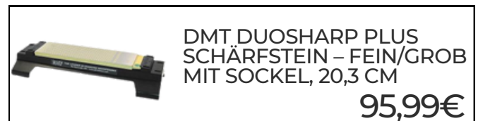
DMT DUOSHARP PLUS SCHÄRFSTEIN - FEIN/GROB MIT SOCKEL, 20,3 CM