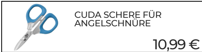
CUDA SCHERE FÜR ANGELSCHNÜRE